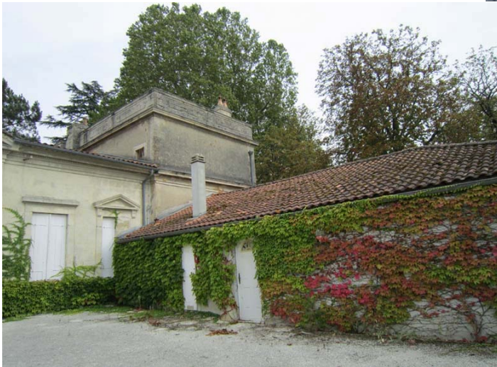
Cour intérieure et dépendance