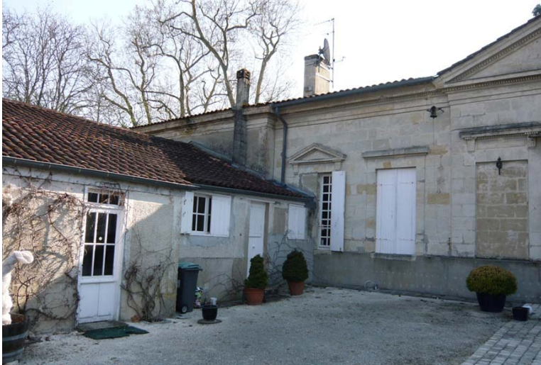
← Façade ouest