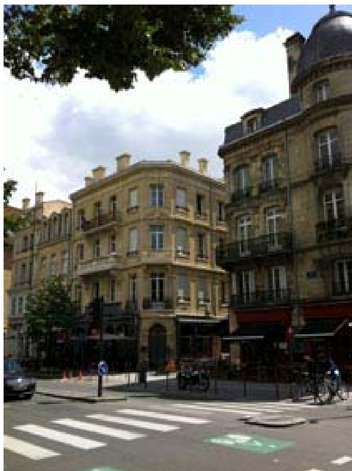
Vue de l'immeuble Créer Patrimoine

Le loyer moyen hors charges pour ces logements est de 430€ par mois environ.